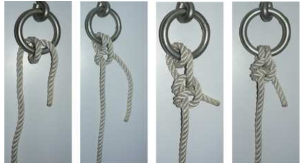
Tour mort + 1/2 clef + 1/2 clef souqué

Le tour mort est destiné à éviter l'usure du cordage sur l'anneau ou le barreau.